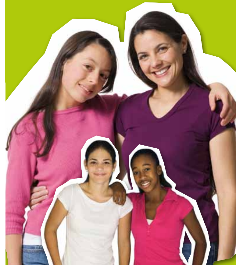
© France 2014 - - SIPREN 1 87 512 777 - DEP/VACUT 14 - Ne pas jeter sur la voie publique.

» La vaccination contre les HPV entre 11 et 14 ans pour éviter demain un éventuel cancer du col de l'utérus.